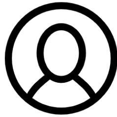
Bild 2: Login-Seite